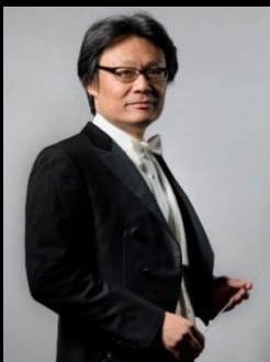
指揮・ナビゲーター

※プレミアムシート(3回セット券)は、伊賀市文化会館のみで販売します。 ※未就学児のご入場はご遠慮ください。 ※車椅子でご来場の方は、伊賀市文化会館までお問合せください。