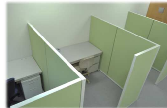
▲ 共用タイプ(ブース)