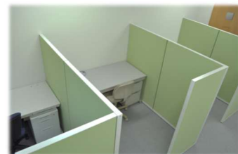
▲ 共用タイプ(ブース)